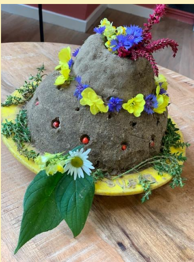
Een prachtige bloemenzandtaart gemaakt door een aantal kinderen uit verschillende groepen.